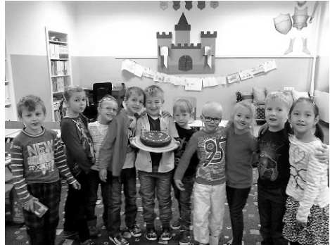
Foto: spoločná oslava narodenín jedného zo žiakov

prijaté, môže sa ich charakter rozvíjať s láskou a smerom k láske.“