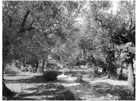
Getsemanská záhrada - Háj olivovníkov

zeleného trňového kríku menšie časti pre pútnikov, aj ja som si jeden menší vypýtal. Trne boli dlhšie, tvrdšie a aj hrubšie než majú naše ruže alebo naše kríky, mali dĺžku asi 5 centimetrov. Predstavoval som si hneď, akú bolesť musel prežívať Pán Ježiš Kristus, keď mu korunu z podobného trnia dávali na hlavu a musel ju nosiť až do smrti. Neďaleko sa nachádzali staroveké hroby, podobné tomu, v ktorom bol pochovaný Ježiš. Po krátkej ceste sme sa dostali na spodný svah Olivovej hory, k bráne Getsemanskej