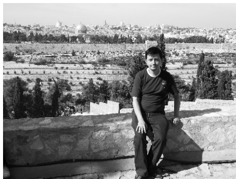
úbočie Olivovej hory

svojej misie v Jeruzaleme. Keď bol Ježiš v tejto oblasti a chcel zostať u svojich priateľov v Bethfage, na svojej ceste do