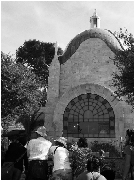
kostol Dominus Flevit

záhrady. Nápis prezrádzal, že sme tam a na bráne bol Jeruzalemský kríž. Pri vchode som zbadal etiópskych pútnikov. Dodnes stojí v záhrade háj s ôsmimi olivovníkmi. Je to