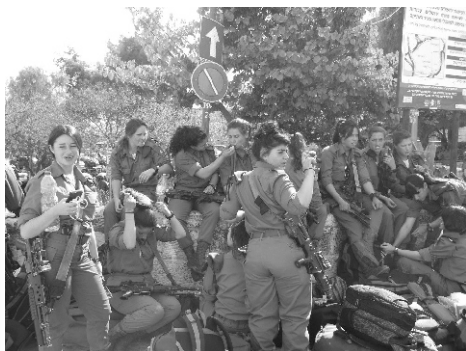
príslušníčky IDF – Izraelských obranných jednotiek