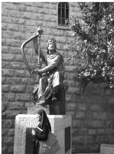
Jeruzalem - Staré mesto, socha kráľa Dávida