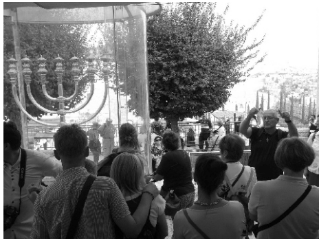
Sedemramenný židovský svietnik menora nad Múrom nárekov

výšky bolo vidieť, že sme pri ňom. Za ním sa týčila mešita Al Aqsa. Pred vstupom armáda skontrolovala skenerom naše batohy a veci. Bezpečnosť tam bola 100-percentná. Otec