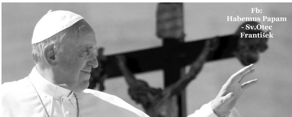
Sv. Otec František

Priniesol všetkým Božiu lásku, ktorá zachraňuje. Ježiš nepriniesol nenávisť, nepriniesol nepriateľstvo: ❤️ priniesol nám lásku! ❤️ Obrovskú lásku, srdce otvorené pre všetkých, pre všetkých nás! Lásku, ktorá zachraňuje! Pápež František