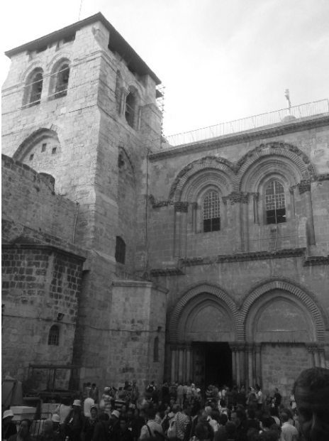
Bazilika Božieho hrobu

zastavenia krížovej cesty boli cestou k nemu. Kostol Božieho hrobu získal dnešný vzhľad v roku 1149, keď ho obnovili po dobytí Jeruzalema križiaci. Pod jednou strechou je Ježišov hrob i miesto ukrižovania - Kalvária (Golgota). V Ježišových časoch bolo toto miesto za hradbami