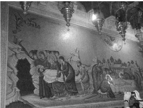
Mozaika znázorňujúca ukladanie tela Ježiša Krista na kameň pomazania a jeho uloženie do hrobu, Golgota

Lebka, ukrižovali jeho i zločincov: jedného sprava, druhého zľava.“ (Lk 23,33) Pri vstupnej bráne do kostola sa najprv nachádza Kameň pomazania - oltár označuje miesto, kde Márii vložili do lona Ježišovo telo po tom, ako ho snáli z kríža. Ježišovo telo ležalo na Kameni pomazania, kde bolo pomazané zmesou myrhy, aloy a vonných olejov a pripravené na pohreb. Hneď pri ňom je mozaika znázorňujúca uloženia Ježiša na Kameň, aj uloženie jeho tela do hrobu. Svätý hrob, najposvätejšie miesto v kresťanskom svete, leží uprostred rotundy v bohato zdobenom monumente. Okolo rotundy bolo postavené lešenie, nakoľko Svätý hrob bol rekonštruovaný. Po vyše hodiny čakania v dlhom zástupe putujúcich pútnikov z rôznych častí sveta sme sa dostali dnu. Za nami boli pravoslávne pútničky z Ruska, ktoré spievali ruské piesne. Rusky mali z úcty na hlavách šatky, aj ramená a