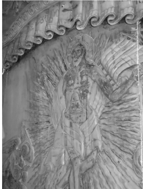
Mramorová mozaika vzkrieseného Ježiša v Božom hrobe

zastavenia krížovej cesty boli cestou k nemu. Kostol Božieho hrobu získal dnešný vzhľad v roku 1149, keď ho obnovili po dobytí Jeruzalema križiaci. Pod jednou strechou je Ježišov hrob i miesto ukrižovania - Kalvária (Golgota). V Ježišových časoch bolo toto miesto za hradbami