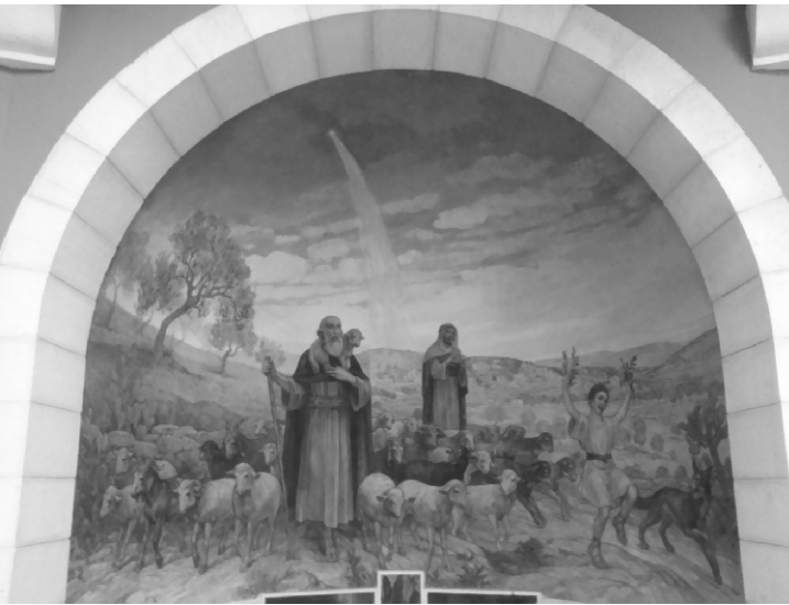
Pole pastierov, predmestie Betlehema

Na druhý deň sme ráno ešte navštívili predmestie Betlehema - Pole pastierov. Žijú tu